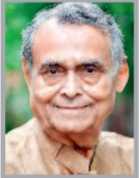
लेखक उप संवाकर जनसंपर्क

उन्होंने प्रदेश के हर वर्ग की बुनियादी सुविधाओं और जरूरतों को ध्यान में रखते हुए पीएम आवास योजना, कृषक उन्नति योजना, नियद लेव्सा नार, अखरा निर्माण योजना जैसी योजनाओं का शुभारम्भ किया है और जनता के बीच अपनी एक अलग छवि निर्मित की है। उन्होंने अपने जीवन का बहुमूल्य समग्र प्रदेश की जनता को समर्पित कर यह सिद्ध कर दिया है कि उनका जीवन केवल उनका नहीं है अपितु प्रदेश की जनता की नि- स्वाध सेवा के लिए समर्पित है। वे सही मारगने में एक ऐसे जननेता हैं जिनके लिए जनता ही सब कुछ हैं। ऐसे सेवामावी और लोकप्रिय जनसेवक बहुत कम होते हैं जिनके लिए जनता का विकास और जनता का साथ ही सबसे महत्वपूर्ण होता है। मुख्यमंत्री श्री साय का अब तक का कार्यकाल इस बात का प्रमाण है कि यदि नेतृत्व ईमानदार, समर्पित और जनता की आकांक्षाओं से जुड़ा हो तो विकास की राह कठिन नहीं होगी।